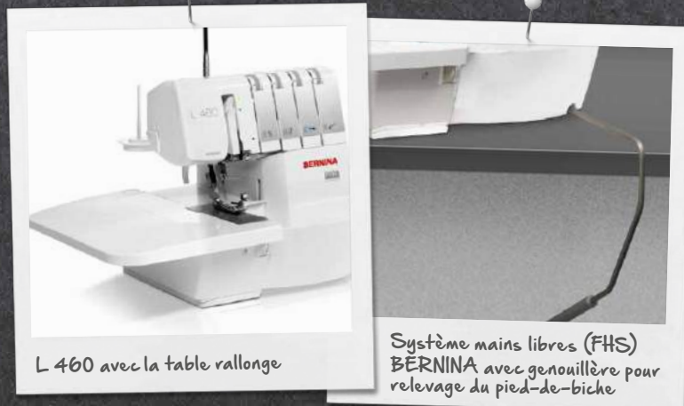
L 460 avec la table rallonge

L'espace de travail bien éclairé de cette surjeteuse facilite la couture et l'enfilage des crochets et des aiguilles. Le système mains libres (FHS) permet de monter et descendre le pied-de-biche à l'aide du genou; les deux mains sont donc libres d'orienter et d'entraîner le tissu. La table rallonge prolonge l'espace de travail, un plus indéniable pour les ouvrages de plus grande envergure.